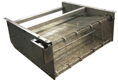
Contronastro in rete, adatto per prodotti ad immersione