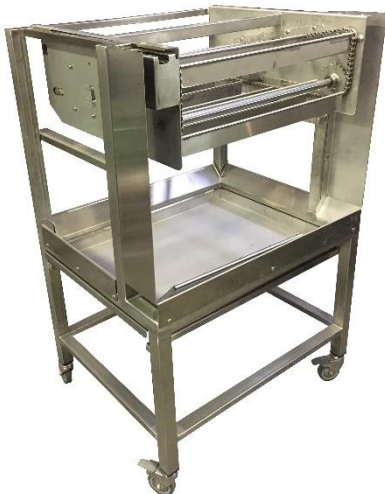
Carrello adatto per il trasporto dei due contronastri