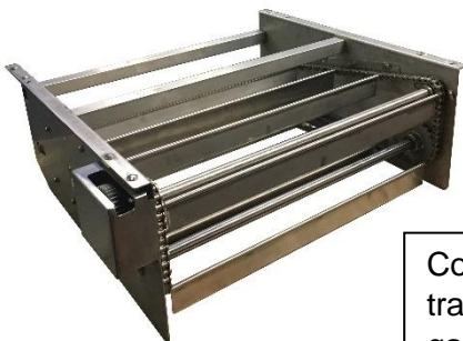
Contronastro con avanzamento tramite palette, adatto per prodotti di galleggiamento